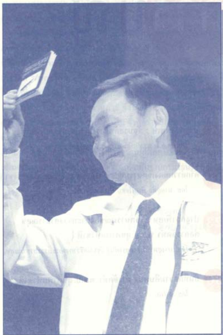
(លើស្នាមចុះតាមលំដាប់ ២ ៧៩៤)