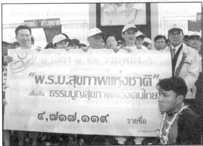
(บริเวณพิธีท้องสนามหลวง 7 ม.ย. 2545)