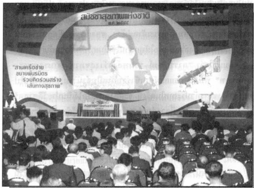
(เวทีสมัชชาสุขภาพแห่งชาติ ๑ ส.ค. ๒๕๔๕)