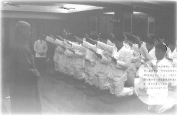
นักศึกษาแพทย์ปริญญาของตน ต่อหน้าท่านธรรมมาจารย์ แจ้งเหยียน เมื่อสำเร็จการ ศึกษา

แล้วทอหุ้มด้วยผ้าขาวสะอาดปิดคลุมด้วยผ้าแพรพรรณอย่างสวยงาม ทั้งนักศึกษาแพทย์ ญาติของอาจารย์ใหญ่และครูอาจารย์ก็จะมาร่วมพิธี ช่วยกันแบกศพอาจารย์ใหญ่เดินเรียงแถว จัดขบวนแห่ศพด้วยความเคารพระลึกถึงในบุญคุณ นำไปทำฌาปนกิจ แล้วเก็บอัฐิบางส่วนใส่ผอบคริสตจักรรูปทรงปราสาทสวยงาม จารึกชื่อแซ่ไว้ทุกท่านแล้วนำไปเก็บไว้ในห้องพระโพธิสัตว์บนอาคารคณะแพทย์ฯ