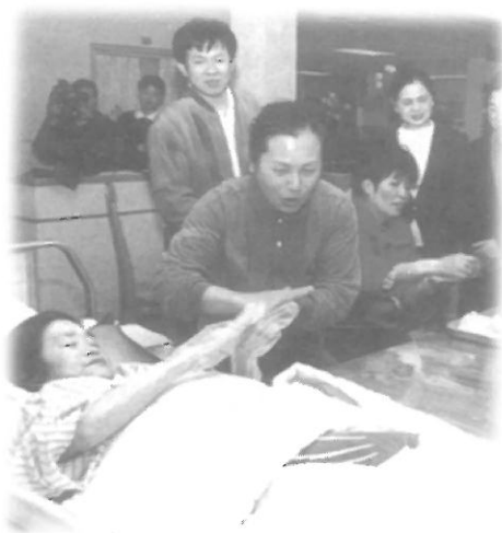
อาสาสมัครจัดซื้อดูแลช่วยเหลือ ผู้ป่วยในโรงพยาบาล