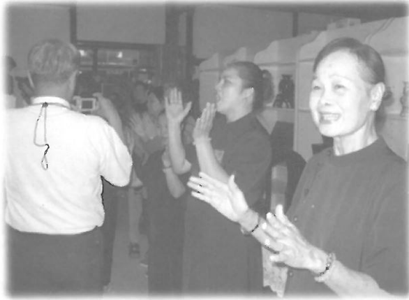
อาสาสมัครชื่อจี้ เข้าแถวร้องเพลงต้อนรับคณะดูงานอย่างสดชื่น

แนวพุทธของชื่อจี้มองว่าคนทุกคนมีเมล็ดพันธุ์แห่งความดีอยู่ในตัว มีธาตุของความรักความเมตตาอยู่ทุกคน ทุกคนจึงควรฝึกฝนจิตให้รู้จักรักและขอบคุณสรรพสิ่งรอบตัว ชาวชื่อจี้จึงนิยมฝึกฝนขอบคุณผู้อื่นอย่างจริงใจและนอบน้อม แม้ไม่ช่วยเหลือใครๆ ก็ยังขอบคุณผู้ที่ให้ช่วยเหลือ การรู้จักขอบคุณ (กั้นเอิน) ถือเป็นภารกิจที่รักและเคารพในผู้อื่น เป็นการพัฒนาจิตของตนอย่างสม่ำเสมอ ด้วยความเชื่อด้วยการฝึกเช่นนี้ทำให้ชาวชื่อจี้เป็นคนมีจิตใจดี มองคนในแง่บวก มองสรรพสิ่งที่เกิดขึ้นด้วยความเข้าใจและมีมีความสุข