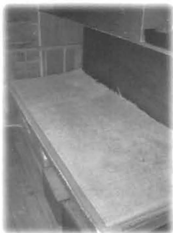
ท่านธรรมาจารย์จี้เหยียน นอนบนแคร่ไม้เล็กๆ ปู ด้วยเสื่อตั้งที่เห็นนี้ตั้งแต่ ออกบวชจนถึงทุกวันนี้

มีพยาบาลคนหนึ่ง เล่าผ่านระบบสนทนา ทางไกลว่า เธอเป็นพยาบาลอายุน้อยจบมาไม่นาน ทำงานอยู่ในห้องคลอด แม้ว่าเรียนพยาบาลมา โดยตรงแต่เวลาแนะนำมารดาเกี่ยวกับการเลี้ยงดูลูก การให้นมลูก มารดาไม่ค่อยเชื่อถือเธอ เพราะเห็น ว่าอายุน้อยและยังไม่ได้แต่งงาน แต่พบว่าคุณป้า คุณน้าคุณอาอาสาสมัครชื่อจี้ที่ไปช่วยให้คำแนะนำ แก่มารดาเหล่านั้น ทำงานได้ผลดีมาก มารดาที่ ได้รับคำแนะนำมักจะเชื่อถือและปฏิบัติตาม นับเป็น สิ่งที่อาสาสมัครน่าจะได้ภาคภูมิใจ