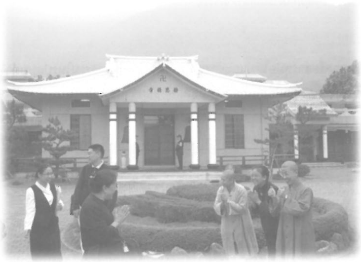
ด้านหน้าของสมณารাজ์ซื่อ ด้านหลังไกลออกไปเป็นขุนเขาทะเลหมอก