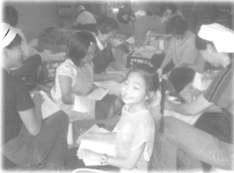
ทั้งเด็กทั้งผู้ใหญ่ มาช่วยกันคัดแยกขยะ ที่ศูนย์ recycle ด้วยความสุขและสดชื่น

ใช้งานและขายนำเงินเข้ามามูลนิธิ อาสาสมัครในชุมชนนั่นเองหมุน เวียนกันมาทำงานในช่วงเวลาที่ แต่ละคนว่างจากภารกิจส่วนตัว เกิดความเป็นชุมชน เป็นกลุ่ม เป็น