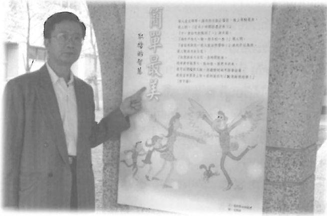
ภาพวาดประกอบ โคลกติดแสดงไว้ ให้เด็กอนุบาล เลือกเรียนรู้ได้ตาม อัธยาศัย