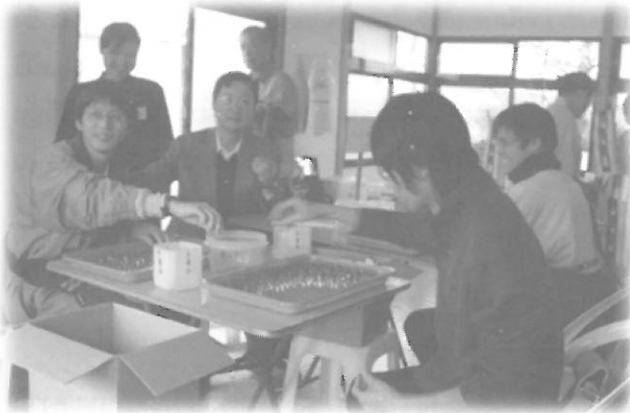
นักศึกษาแพทย์ปีหนึ่งของฉ้อจี้ไปทำงานอาสาสมัคร (ทำฐานเทียน) ที่สมณารามจิ้งซือ คนหนึ่งที่ 2 จากซ้ายมือคือ ผมเอง