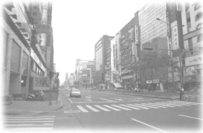
สภาพกรุงไทเป