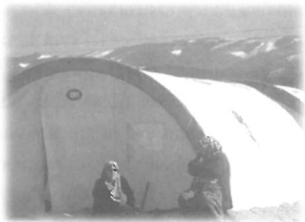
มูลนิธิพุทธเจ้อจีส่งสิ่งอำนวยความสะดวกไปช่วยเหลือผู้ประสบภัยแผ่นดินไหวที่ตุรกี

งานสังคมสงเคราะห์เล็กๆ ที่เคยทำมาตั้งแต่อดีตก็ไม่หยุด เช่น การช่วยเหลือผู้ยากไร้ ในขณะที่ขยายไปจับงานใหญ่และใหญ่มาก เช่น การเข้าไปช่วยเหลือประชาชนที่ประสบภัยแผ่นดินไหวครั้งใหญ่ทางตอนใต้ของไต้หวันเมื่อปี พ.ศ. 2542 มีคนไต้หวันเสียชีวิตหลายพันคน บาดเจ็บอีกมากมาย บ้านเรือน อาคารสถานที่ต่างๆ เสียหายเป็นจำนวนมาก มูลนิธิพุทธเจ้อจีส่งหน่วยอาสาสมัครเข้าไปช่วยเหลือเป็นกลุ่มแรก ทำงานช่วยเหลือหลายด้านอย่างต่อเนื่องนานถึง 5 ปี ถอนตัวออกมาเป็นหน่วยสุดท้าย โดยช่วยรัฐบาลก่อสร้างโรงเรียนทดแทนให้ชุมชนต่างๆ มากถึง 51 แห่ง ทุกแห่งก่อสร้างด้วยเทคโนโลยีทันสมัยเพื่อป้องกันแผ่นดินไหวในอนาคต จึงต้องใช้เงินหลายหมื่นล้านเหรียญ โดยค่อยๆ ระดมรับบริจาคขยายวงออกไปเรื่อยๆ ใช้เวลาดำเนินงาน 2 ปีกว่า จึงแล้วเสร็จ