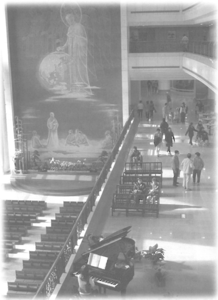
ในบริเวณโรงพยาบาลของจีอี ด้านซ้ายล่าง คือ บริเวณใช้สำหรับประชุม/ปฏิบัติธรรม ชั้นบนถัด มากลางภาพ มีอาสาสมัครกำลังเล่นเปียโนให้คนไข้และญาติฟัง ที่เห็นรถผู้ป่วยเป็นอาสาสมัครมา ช่วยทำงานบริการในโรงพยาบาล