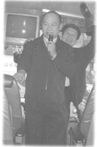
2 ใน 6 ของอาสาสมัครชื่อจี้จากไทยตามไปดูแลคณะดูงานถึงไต้หวัน