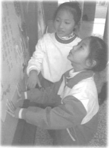
2 หนูน้อยอนุบาลพุทธฉือจี้ กำลังเรียนรู้ ด้วยตนเองกันอย่างสนุกสนาน

นอกจากการเรียนวิชาการ เด็กจะ ได้เรียนเพื่อพัฒนาด้านศิลปวัฒนธรรม คุณธรรมและจริยธรรม สอดแทรกตลอด เวลา เช่น ต้องเรียนการจัดดอกไม้เพื่อฝึก ให้เป็นคนมีศิลปะ จิตใจละเอียดอ่อน เข้าใจธรรมชาติ เรียนการชงชา ฝึกการ ล้างมือเพื่อล้างใจ ฝึกสมาธิ ฝึกการ ทำงานที่ละเอียดประณีตมีขั้นมีตอน ฝึก การบริการผู้อื่น ฝึกรอคอย ฝึกช่วยเหลือ ฝึกรับบริการจากผู้อื่นด้วยจิตใจที่ระลึก ในพระคุณของผู้อื่น