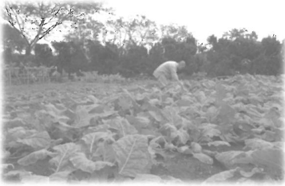
แปลงผักที่นักบวชและอาสาสมัครฉ้อจี้ช่วยกันปลูกในบริเวณสมณารามจิ้งซือ