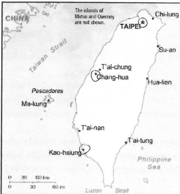
แผนที่ไต้หวัน

เมื่อเอ่ยถึงไต้หวัน แต่ละคนคงคิดถึงเรื่องที่แตกต่างกัน บางคนอาจคิดถึงประเทศที่ ส.ส. ในสภาขออบตบตีกันจนเป็นข่าวไปทั่วโลกอยู่บ่อยๆ บางคนอาจคิดถึงประเทศที่มีแรงงานไทยไปรับจ้างทำงานเป็นแสนและเคยมีเหตุการณ์คนงานไทยก่อจลาจลจุดไฟเผาที่พักเพราะถูกกดขี่ข่มเหงจนเหลือทน บางคนอาจคิดถึงนักธุรกิจไต้หวันที่เข้ามาลงทุนทำธุรกิจมากมายในประเทศไทยของเรา ผู้ที่มีอายุมากขึ้นอาจคิดถึงจีนชาวจีนที่อพยพหนีคอมมิวนิสต์จีนแผ่นดินใหญ่ไปตั้งรัฐบาลพลัดถิ่นที่หมู่เกาะฟอร์โมซาและประกาศตนเป็นสาธารณรัฐจีนเมื่อราว 50 ปีก่อน บางคนอาจคิดถึงประเทศที่คนส่วนใหญ่นับถือพุทธนิกายมหายานที่เน้นการปฏิบัติธรรมด้วยการช่วยเหลือผู้อื่นตามหลักความเมตตากรุณาของพระโพธิสัตว์ ฯลฯ