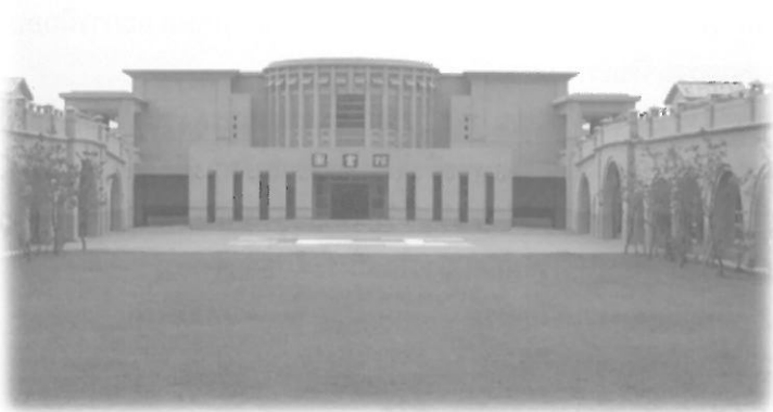
มุมหนึ่งในโรงเรียนอนุบาลพุทธฉือจี้ที่ฮวาเหลียน

บริเวณโรงเรียนอนุบาลที่ไปดูงาน จัดสถานที่สวยงาม สะอาด เป็นระเบียบมาก นักเรียนมีระเบียบวินัยดีมาก เวลาถอดรองเท้าเข้าห้อง ทุกคนจะจัดเรียงรองเท้าอย่างเป็นระเบียบหันหัวรองเท้าออกแบบสไตลญี่ปุ่น ทุกตึกจะมีห้องเอนกประสงค์ให้นักเรียนได้ทำกิจกรรม มีห้องเรียน ห้องสมุด ห้องปฏิบัติธรรม ห้องเรียนจัดดอกไม้ ห้องเรียนการชงชา มีสวนครัว สวนเกษตร มีพื้นที่สำหรับฝึกฝนกีฬาทั้งในร่มและกลางแจ้ง มีหอพัก ฯลฯ เรียกว่าในเชิงสถานที่และอุปกรณ์มีอย่างครบครัน เด็ก ป.1 ได้เริ่มเรียนภาษาอังกฤษแล้ว พอถึง ป.3 ได้เรียนภาษาอังกฤษ 4 ชั่วโมงต่อสัปดาห์