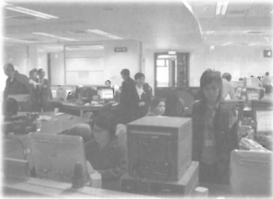
บรรยากาศส่วนหนึ่งของ สถานีโทรทัศน์ด้าอ้าย