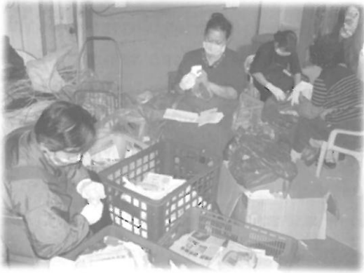
อาสาสมัครกำลังช่วยกันคัดแยกขยะที่ศูนย์ recycle ขยะแห่งหนึ่งในไทเป