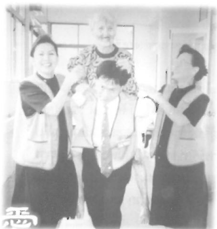
อาสาสมัครจัดซื้อแบกผู้สูงอายุขึ้นหลังด้วยความเต็มใจ