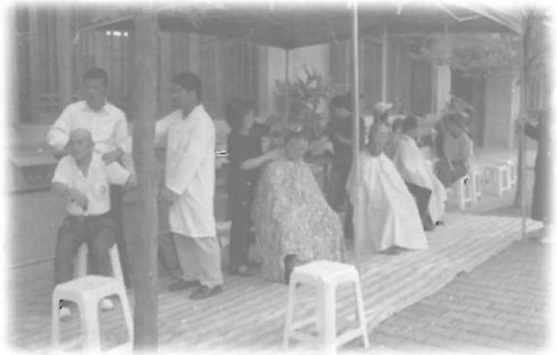
บริการประชาชนที่จัดทุกเดือนในสมณารามเพื่อช่วยสงเคราะห์อย่างสม่ำเสมอและต่อเนื่อง