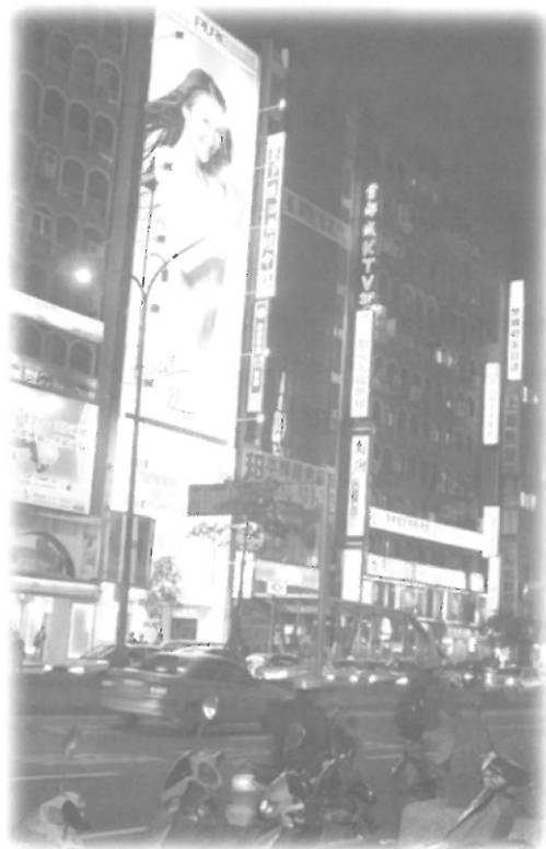
กรุงไทเปยามราตรี