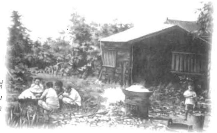
กระท่อมหลังนี้ คือ สถานที่ ทำน้กเพื่อปฏิบัติธรรม และเริ่มก่อตั้งมูลนิธิพุทธ จีอจี เมื่อ 10 ปีก่อน

จากนั้นไม่นาน มีแม่ชีคาทอลิก 3 ท่านมาเยี่ยม เห็นสภาพความยากลำบาก ของท่านอาจารย์ ก็ชวนอาจารย์เปลี่ยนมาบวชเป็นชีคาทอลิก โดยมีความเห็นว่ ศาสนาพุทธไม่เอาใจใส่ความทุกข์ยากของคนในสังคม ไม่ช่วยแก้ปัญหาสังคมอย่าง เป็นรูปธรรม พุทธศาสนิกชนส่วนใหญ่ไม่หาธรรมะเพื่อพัฒนาตนเองเท่านั้น แต่ท่าน อาจารย์ไม่มองเช่นนั้น อาจารย์เห็นว่าหลักพุทธธรรมไม่เพียงแต่สอนให้คนรักเพื่อน มนุษย์ด้วยกันเท่านั้น แต่ยังสอนให้รักสรรพสัตว์และสรรพสิ่งรอบตัวด้วย และยังสอน ให้ชาวพุทธเป็นผู้ให้โดยไม่หวังผลตอบแทนด้วย แม่ชีคาทอลิกจึงเสนอว่า ถ้าอย่าง นั้นทำไมไม่รวมชาวพุทธทำคุณประโยชน์เพื่อสังคมเล่า