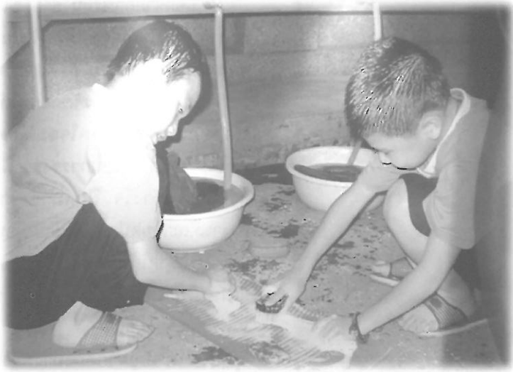
นักเรียนตัวน้อยๆ ได้รับการฝึกนิสัยให้เป็นผู้ไม่ทำงานทุกประเภท

นักเรียนคนไหนเรียนดี มีนิสัยดีจะได้รับมอบหน้าที่ตักอาหารบริการครู นักเรียนที่ได้รับหน้าที่นี้จะดีใจมากเวลานักเรียนนำอาหารไปบริการครู ครูจะยกมือไหว้ขอบคุณ นอกจากนี้ยังได้มีโอกาสล้างส้วม ใครที่ได้รับหน้าที่ล้างส้วมจะดีใจมากเพราะถือว่าจะต้องทำดีจึงจะได้รับมอบหน้าที่นี้ การฝึกอบรมเช่นนี้มีผลทำให้เด็กนักเรียนไม่รังเกียจงานใช้แรงงาน ไม่รังเกียจการทำงานสกปรก ไม่มองว่าเป็นงานต่ำต้อยซึ่งตรงข้ามกับการสร้างทัศนคติในบ้านเมืองเรา