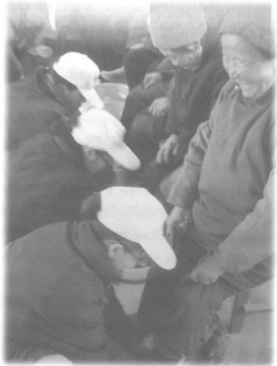
อาสาสมัครฉือจี้ ดำรงทำให้ผู้สูงอายุด้วยความอบอุ่น สงเกตใบหน้าจะเห็นว่าคุณยายมีความสุขสุดๆ

การดำเนินงาน ของมูลนิธิ อาศัยพลัง ของอาสาสมัครฉือจี้ (แต่งกายเสื้อน้ำเงิน กางเกงขาวหรือบาง กรณีก็เป็นชุดสีน้ำเงิน) ที่ มีการ คัด เลือ ก และ