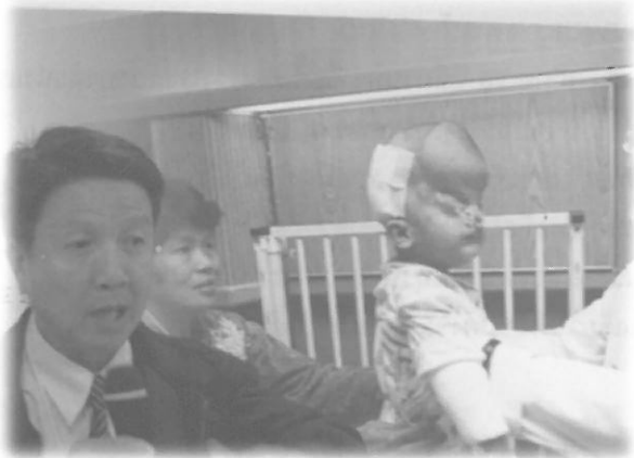
ภาพแสดงถึงจิตใจ บริการด้วยหัวใจของ ความเป็นมนุษย์ของ แพทย์ชาวฉือจี้