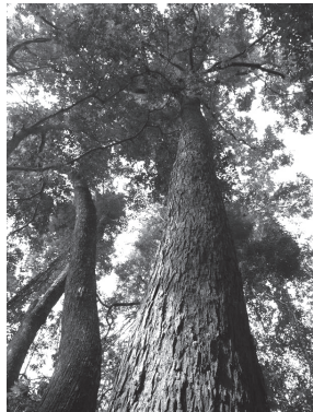
ต้นไผ่ใหญ่สุดให้เห็นไปทั่วผืนป่าบ้าน้ำ

“คือถ้ามีท่องเที่ยว ก็ต้องมี ธุรกิจท่องเที่ยวในหมู่บ้าน มันเป็น ธุรกิจเล็กๆ ซึ่งเราไม่ได้ทำอย่างนั้น เราอยากให้เป็นศูนย์กลางการเรียนรู้ มาเรียนรู้กับชาวบ้าน มาเรียนรู้กับชุมชนมากกว่า ไม่ใช่เป็นศูนย์ท่องเที่ยว”