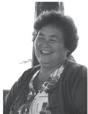
สีหน้ารื่นเริงของป้าภาค ก็สัญลักษณ์ ความสุขของแม่บ้านทุ่งยาว

“ถ้าพูดถึงความสุขแล้ว ป่าว่า ไม่ต้องไปหาให้ไกล ไม่ต้องไปหาที่อื่น คือหาที่ตัวเรานี้ หาที่บ้านเรานี้แหละ ในตัวเรานี้ คือถ้าเราบอกว่าพอ มันก็มี ความสุขแล้ว คือแค่เรามีอยู่มีกิน เราก็กิน พอใจแล้ว ถึงแม้ว่าชีวิตความเป็นอยู่ ของเรามันจะไม่เลิศหรูอะไร แต่ว่า ที่เห็นๆ นั่นแหละว่า เขาหลับ เราก็กิน หลับ เขากิน เราก็กินเหมือนเขา อันนี้ ก็อาจจะเรียกได้ว่าเป็นความสุขแล้ว แต่เรื่องความร่ำรวยอะไรนั้นไม่เคยคิด ไม่ได้คิดเลย...”