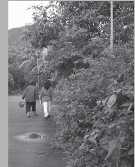
รับรั้วมีแต่ผักพื้นบ้านปลูก ลาบเลี้ยวไปทั่ว

หากเราเดินไปตามถนน ชอกชอยภายในหมู่บ้านทุ่งยาว ตามริมรั้ว บ้านของแต่ละหลังคา เราจะมองเห็นผักไม้ ใช้เครือทอดเลื้อยพันกันแน่นหนา ไม่ว่าจะ จะเป็นตำลึง ผักฮ้วน ผักเชียงดา เมื่อมอง เข้าไปในรั้ว ก็จะมีแปลงผักที่ปลูกกันสลับ ไว้ไม่ต้องเป็นระเบียบอะไรมากนัก ซึ่งถือได้ ว่าเป็นผักพื้นบ้านที่ปลูกทิ้งไว้ ปล่อยให้มัน เติบโตเองตามธรรมชาติ ถึงเวลาเจ้าของบ้าน ก็เดินไปเด็ดเก็บมาทำอาหารได้เลย