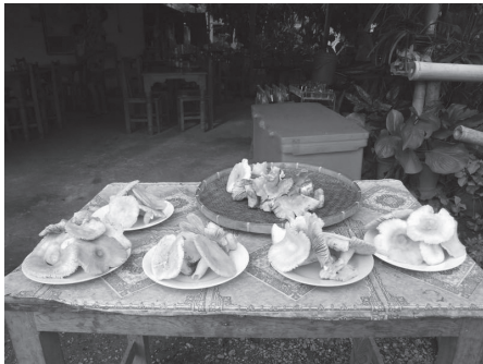
เห็นจากป่า บำบาวชายเป็นรายได้เสริม ให้กับแม่บ้านทุ่งยาว

ซึ่งเป็นสมุนไพรก็เอามาหมด พอเอามาแล้วก็ให้เขาเอาไปปลูกในป่าอย่าง ต้นไผ่ ไม้หกหรือว่าไผ่หก ก็ให้เขาเอาไปปลูก แล้วมันมีคนทีอื่นมาทำนา ในหมู่บ้าน มาขนเอาต้นไม้เราไปเราก็ไม่ว่า ก็เอาไปเถอะ เราก็บอกอย่าง เอาไปปลูกเถอะ ขอให้มันได้กินเถอะ...”