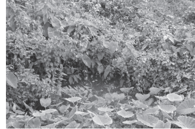
ตาบ่า บึงน้ำขับ สัญลักษณ์ของความ สมบูรณ์ของผืนป่าบ่า

“เรื่องความซิด หรืออาเพศ เรื่องประเพณี เราก็บอกให้เด็ก อย่างพอ เราารู้เรื่องอาหารป่าแล้ว ป่าเราก็มีวัฒนธรรมประเพณี จารีตประเพณีที่เราเลี้ยง ผีฝาย สืบชะตาป่า เดือน เก้าเหนือขึ้นเก้าค่ำก็ไปสืบ ชะตาป่า ทำพิธีทางศาสนา แล้วก็ทำพิธีเลี้ยงผีเอา หมูเขาไปในนั้นตัวหนึ่ง