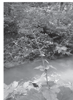
ดอกบวบสวรรค์ (ต้นปจ)