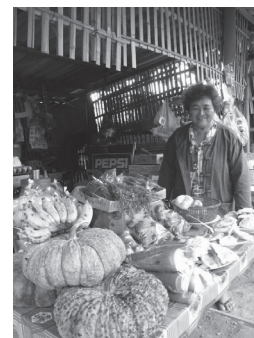
ป้าภาคี พาญาติผักพื้นบ้าน วางขายอยู่ริมถนน

“เดี๋ยวนี้ชาวบ้านที่นี้ไม่นิยมซื้อผักจากข้างนอกมากิน ผักที่แปลงไปอย่างกะหล่ำปลี บรอกโคลี กระบี่ เขาว่าไม่อร่อย กลัว มียาฆ่าหญ้า ผสม บ้านเราก็มีผักที่อยู่ตามธรรมชาติเยอะแล้ว ไม่จำเป็นต้องไปหาซื้อ