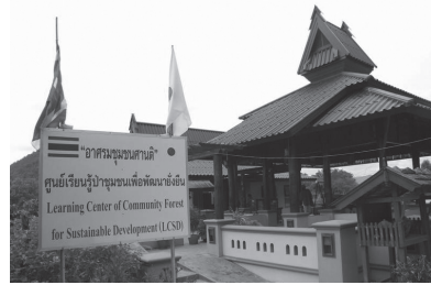
อาคารชุมชนคนชาติ ศูนย์การเรียนรู้ป่าชุมชน เพื่อพัฒนายั่งยืน ขอบ้านทุ่งยาว

จริงสิ ผมเข้าใจที่ ยาวปฏิบัติธุรกิจท่องเที่ยวแบบนั้น คง เพราะเห็นว่าเป้าหมายของการอนุรักษ์ ดิน น้ำ ป่า เพื่อความมั่นคงทางอาหาร จะเพี้ยนไป กลายเป็นการทำลายทรัพยากร ไปในที่สุด