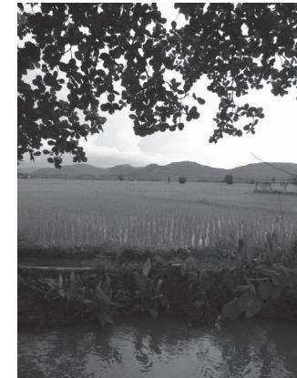
ทุ่งยาวจากต้นดอยลงสู่ที่ราบลุ่ม คือที่มาของชื่อหมู่บ้านทุ่งยาว

แน่นอน แม้กระทั่งไม้ในฝั้นป่าน้ำจ๋าก็ถูกลักลอบตัดด้วย ซึ่งทำให้ชาวบ้านทุ่งยาวต่างมองเห็นปัญหาที่จะตามมาในอนาคต