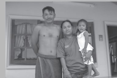
รอยยิ้มที่อบอุ่นของดำกับภรรยาและลูกสาว