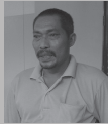
“บ้าเสบ” แสบ เมฆหมอก