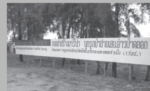
การต่อสู้อีกครั้งหนึ่งของชาวป่าคลองกับมหันตภัยระลอกปัจจุบัน (ภาพถ่ายจากริมน้ำป่าคลองเมื่อวันที่ 12 กันยายน 2551)