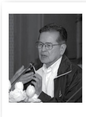
ศ.นพ. ประเวศ วะสี