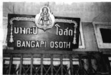
คลินิก บางกะปิ โอสธ