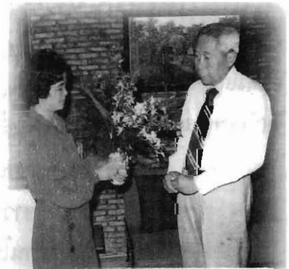
กับอาจารย์ภา เศรษฐจินดา อธิบดีตำรวจกองปราบปรามคดีอาชญากรรมคนแรก

ทุกวันนี้ลูกมีความรู้สึกที่วันหนึ่งๆ เร็วมาก เดียวก็วันหนึ่งๆ ทำให้คนมีอายุสูงตามวันปี แต่ร่างกายยังแข็งแรง กระฉับกระเฉงเป็นส่วนใหญ่ ลูกได้ปฏิบัติงานมาเป็นเวลานานกับคุณพ่อ เพื่อทำผ่าตัดที่โรงพยาบาลกลาง (ขณะนั้นโรงเรียนพยาบาลสังกัดโรงพยาบาลกลาง และลูกเรียนอยู่ชั้นปีที่ ๒ ซึ่งต่อมาก็โอนมาเป็นโรงเรียนพยาบาล โรง-