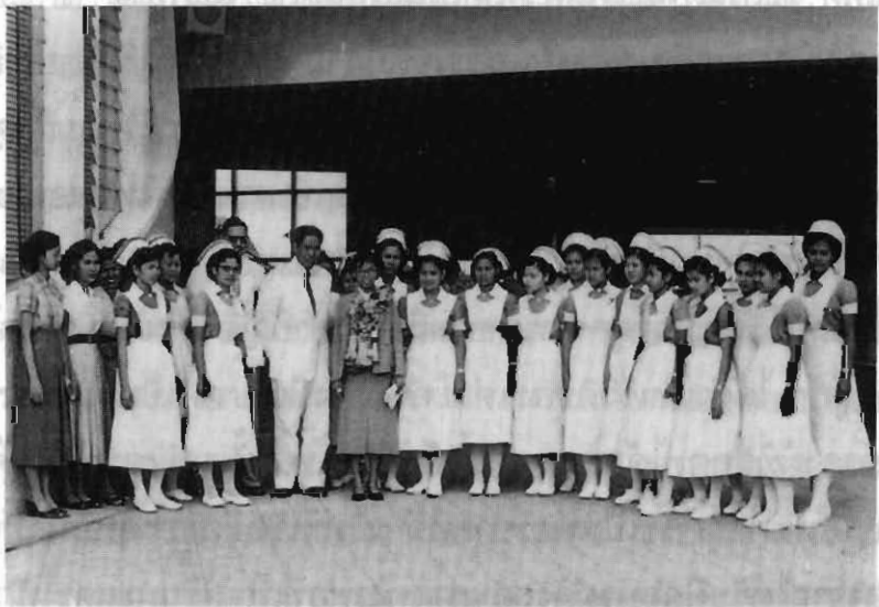
ส่งพยาบาลไปเรียนต่อต่างประเทศ

100/26 หมู่บ้านรามอินทรา นีเวศน์ ถ.รามอินทรา 67 กรุงเทพฯ 10230