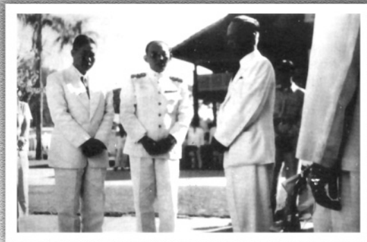
■ จอมพล ป. พิบูลสงคราม, พ.ท.นพ.นิตย เวช-วิศิษฐ์ และนพ.เสม พริ่งพวงแก้ว สามผู้บุกเบิก การสาธารณสุขของไทยในยุคก่อนกึ่งพุทธกาล