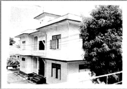
■ โรงพยาบาลเชียงรายประชานุเคราะห์ โรงพยาบาลที่สร้างจากเงินบริจาค ของประชาชน