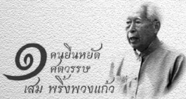
■ บางส่วนของกลุ่มไปยเซียน