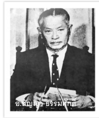
อ.สัญญา ธรรมศักดิ์

สมัยรัฐบาล อาจารย์สัญญา ธรรมศักดิ์ มีรัฐมนตรีที่โดดเด่นมากอีกท่านหนึ่งที่สื่อมวลชนพากันชื่นชมอย่างเอิกเกริก คือ หลวงอรรถสิทธิ์ สิทธิสุนทร รัฐมนตรีว่าการกระทรวงมหาดไทย ซึ่ง ‘หาญกล้า’ สั่งย้ายผู้ว่าราชการจังหวัด ๒ จังหวัด แต่ “ปัญญาชน