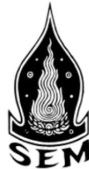
■ โลโก้ เสมสิกขาลัย

เมื่อพวกเราไปขออนุญาต ทำหนังสือประวัติของท่าน ท่าน ปฏิเสธอยู่ถึง ๔ ปี กว่าจะยอมให้ ทำออกมา แต่กรณี 'เสมสิกขาลัย' ท่านยอมอนุญาตในเวลาค่อนข้าง รวดเร็ว 🦋