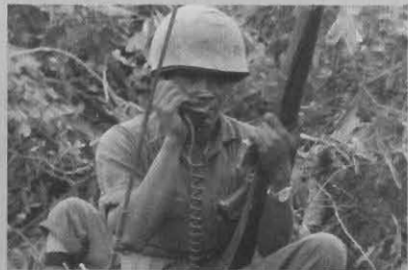
ในสนามรบ ณ จังหวัดเบียนฮว่า สาธารณรัฐเวียดนาม