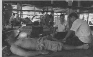
หมอรุ่นพี่สอนหมอรุ่นน้อง โดยให้คนไข้เป็นครู