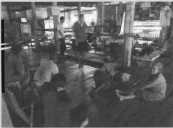
ญาติโยม และคนไข้ ที่มารักษาเบิยยาที่วัด