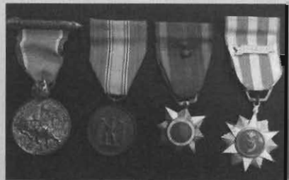
เหรียญที่ระลึกในราชการสงคราม