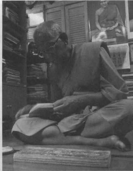
หลวงพ่อกับคัมภีร์โบราณของสายตระกูล

โรงหมอนี้มีการผลิตยาแผนโบราณในรูปแบบยาหม้อ ยาผง ยาลูกกลอน ยาน้ำมันยาประคบ และยาอบ โดยใช้สมุนไพร ไม่น้อยกว่า ๑๗๐ ชนิด เฉพาะ“ยาอบ” ที่ใช้ในโรงอบไอน้ำสมุนไพร ซึ่งทางวัดเปิดให้บริการมาตั้งแต่ปี ๒๕๒๓ก็มีตัวยาทั้งหมด ๔๓ ชนิด