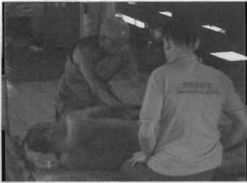
หลวงพ่อยังคงตรวจสอบสุขภาพโรคด้วยตัวท่านเอง