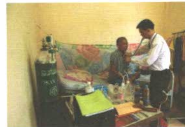
ภาพถ่ายโดย : สถาบันรับรองคุณภาพสถานพยาบาล (องค์การมหาชน)