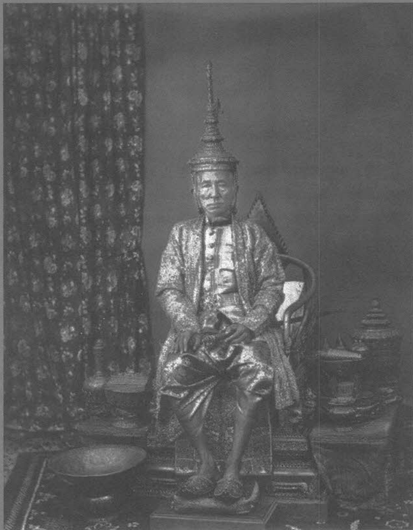
พระบาทสมเด็จพระปรมินทรมหามงกุฎฯ พระจอมเกล้าเจ้าอยู่หัว