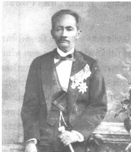
เจ้าพระยาสุรวงศ์วิวัฒน์ (จรรยา นุนนาค)

การที่พระบาทสมเด็จพระจอมเกล้าเจ้าอยู่หัวทรงเรียกพระยาสุรวงศ์วิวัฒน์เข้าไป “ฝากฝัง ตั้งเสี้ยมราชการแผ่นดิน” เพราะสมเด็จพระเจ้าลูกยาเธอฯ ทรงเป็น “ลูกเขย” ของเจ้าพระยาสุรวงศ์วิวัฒน์ด้วย,