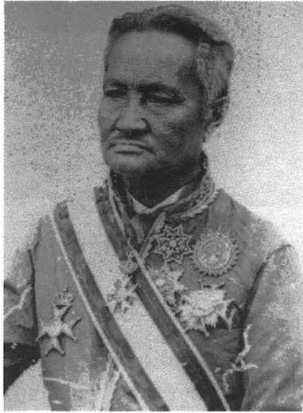
เจ้าพระยามหาคีรีสูริยวงศ์ (ช่วง บุนนาค)