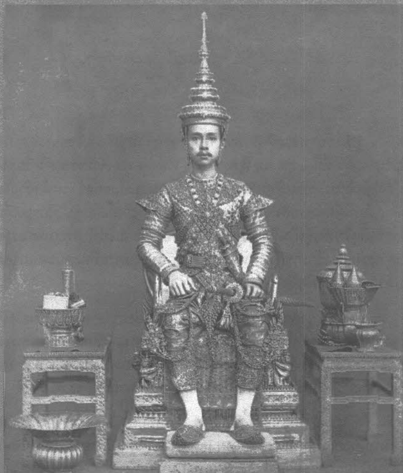
พระบาทสมเด็จพระปรมินทรมหาจุฬาลงกรณ์ พระจุลจอมเกล้าเจ้าอยู่หัว