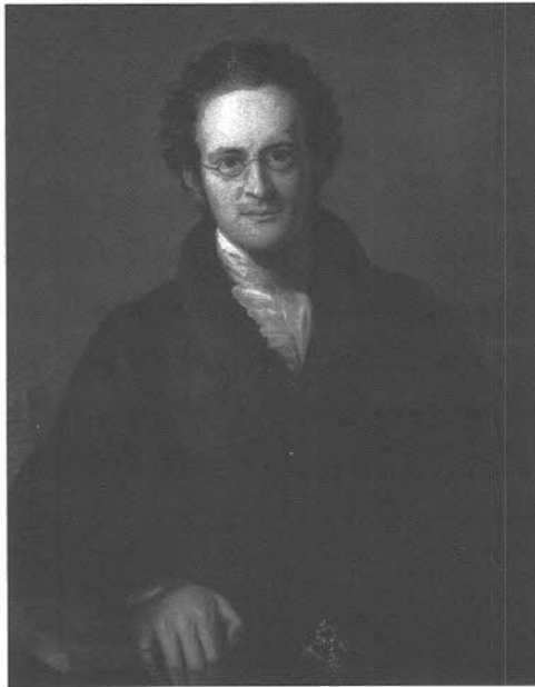
เซอร์จอห์น บอว์ริง (Sir John Bowring)

“ข้อความที่กล่าวมา ผู้มีสติปัญญา เช่น เจ้าพระยาศรีสุริยวงศ์ ย่อมจะคิดเห็นและคิดหาทางแก้ ซึ่งเห็นมีแต่ ๒ ทาง คือ ทางหนึ่ง หลีกตัวเสีย อย่าให้ต้องเป็นผู้ว่าราชการแผ่นดิน หรืออีกทางหนึ่ง ถ้าจำจะต้องเป็นผู้ว่าราชการแผ่นดิน ก็ให้มีอะไรเป็นเครื่องป้องกัน อย่าให้คนทั้งหลายสงสัยว่าท่านจะชิงราชสมบัติ อันนี้ น่าจะเป็นมูลความคิดของเจ้าพระยาศรีสุริยวงศ์ ที่ให้กรมหมื่นบวรวิชัยชาญเป็นพระมหาอุปราช ตรงตามที่ผู้อื่นคิดเห็นกันโดยมาก ท่านอาจจะคิดเห็นต่อไปว่าไม่มีการเสี่ยงภัยอันใดในเรื่องสืบราชสันตติวงศ์ ด้วยกรมหมื่นบวรวิชัยชาญพระชันษาแก่กว่าสมเด็จพระเจ้าอยู่หัวถึง ๑๖ ปี คงจะล่วงลับไปก่อนสิ้นรัชกาลที่ ๕ ไม่มีช่องจะได้รั้งราชทายาท”