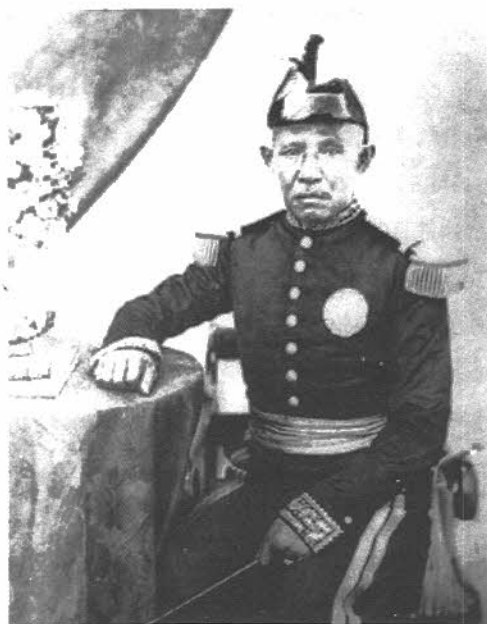
พระบาทสมเด็จพระปิ่นเกล้าเจ้าอยู่หัว

แต่พระบาทสมเด็จพระปิ่นเกล้าเจ้าอยู่หัวเสด็จสวรรคตก่อนด้วยพระโรควิธโรค เมื่อ พ.ศ. ๒๔๐๘ ขณะนั้นรัชกาลที่ ๔ มีพระชนมายุล่วงเข้า ๖๑ พรรษาแล้ว ส่วนรัชกาลที่ ๕ ทรงมีพระชนมายุเพียง ๑๒ พรรษา ยังทรงพระเยาว์นัก