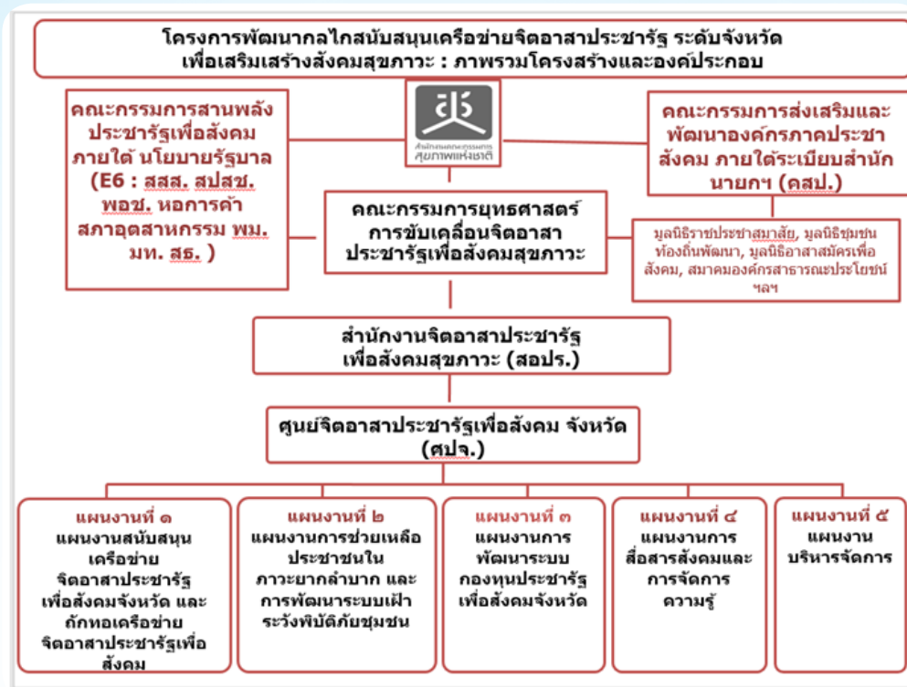
แผนภาพ ๑.๑ แผนงานภายใต้โครงการพัฒนากลไกสนับสนุนเครือข่ายจิตอาสาพระราชัฐระดับจังหวัดเสริมสร้างสังคมสุขภาวะ พ.ศ. ๒๕๖๐